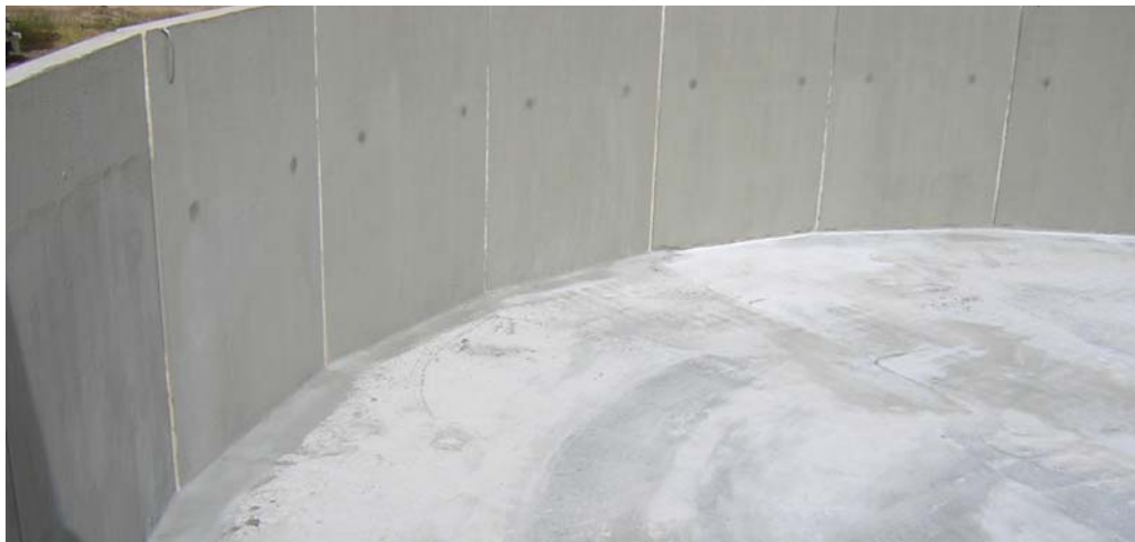
SELLADO E IMPERMEABILIZACIÓN DEL DEPÓSITO (A REALIZAR POR PREHORMISA)