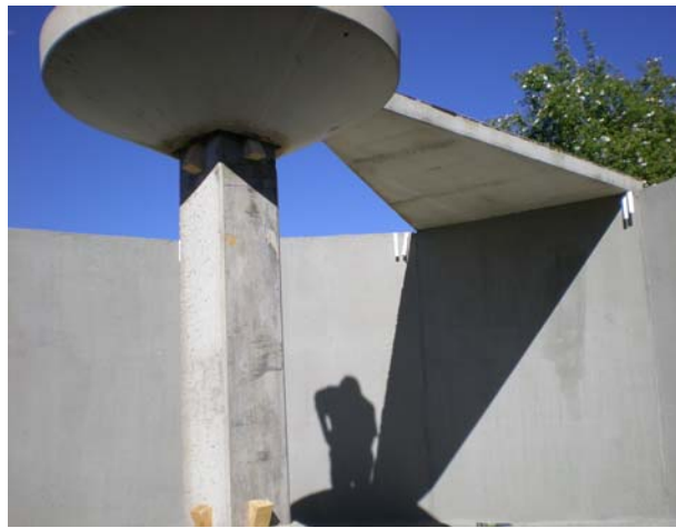
COLOCACIÓN DEL CAPITEL Y PILAR (A REALIZAR POR PREHORMISA)