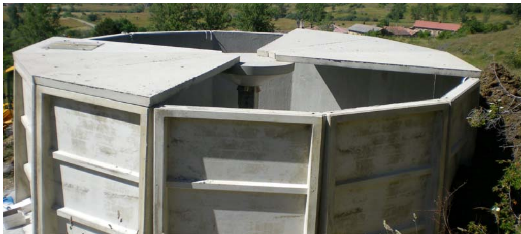
MONTAJE DE LA TAPA Y POSTERIOR SELLADO (A REALIZAR POR PREHORMISA)