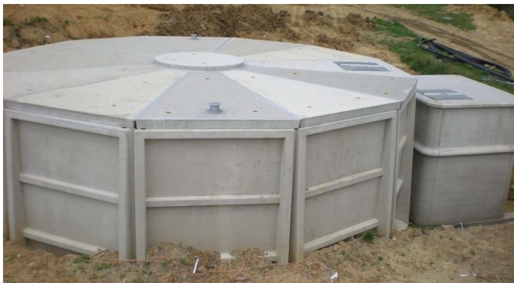
DEPÓSITO TERMINADO CON TAPA Y CASETA