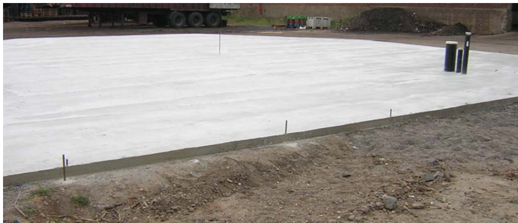
SOLERA DE LIMPIEZA NIVELADA (A REALIZAR POR EL CLIENTE)