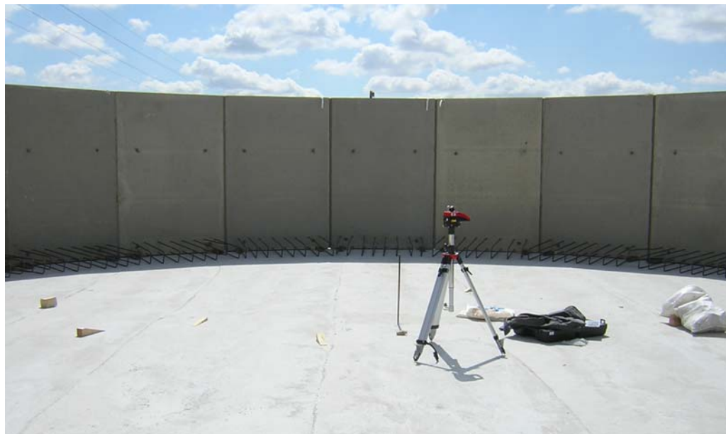
COLOCACIÓN DE PANELES (A REALIZAR POR PREHORMISA)