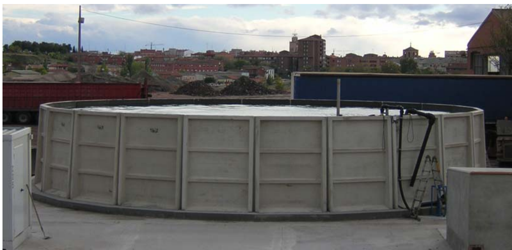
DEPÓSITO SIN TAPA TERMINADO